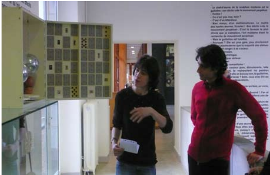
Jeu de hasard au musée de l'objet Boîte votre portrait, Tetsumi Kudo, 1965. AUREORE OBELLIANNE 2008 PROJET CAC 40