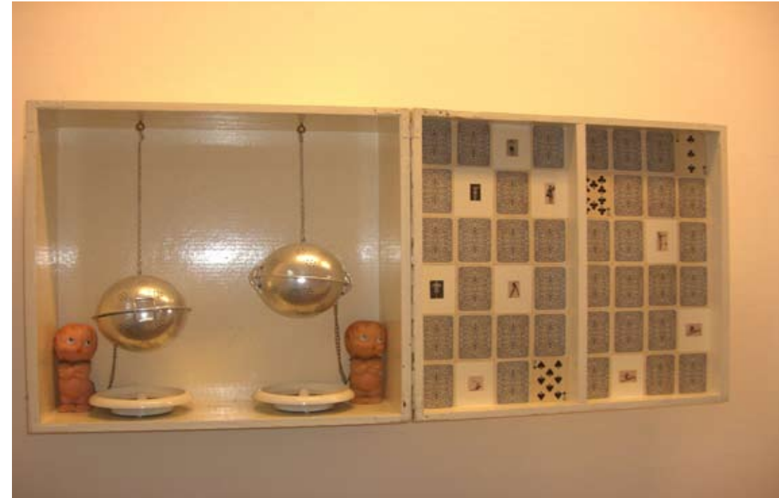
Boîte votre portrait (1965)